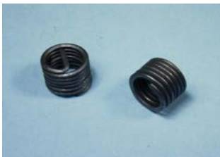
DRY FILM LUBED